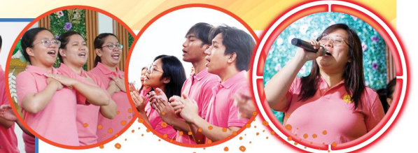
Sa pagsisimula pa lamang ng gawain ay nananabik na ang lahat sa presensiya ng Diyos. Tunay na wala nang mas sasaya pa sa piling Niya.