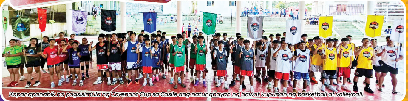
Kapanapanabik na pagsisimula ng Covenant Cup sa Casile ang natunghayan ng bawat kupunan ng basketball at volleyball.

Matapos ang ilang linggong paghihintay ay naganap na nga ang opening ceremony ng UCF Covenant Cup 2026 noong Abril 11, Sabado, hudyat ng pagsisimula ng palaro ng basketball at volleyball na nilahukan ng mga ulirang ina, magiging na tatay at kabataan ng Brgy. Casile.