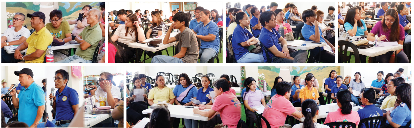
Naging oportunidad din ito upang ang mga katanungan ng mga dumalo ay mabigyang linaw.

Purihin ang Diyos sa pagtawag Niya sa bawat isa at sa pribilehiyong maglingkod sa Kaniya!