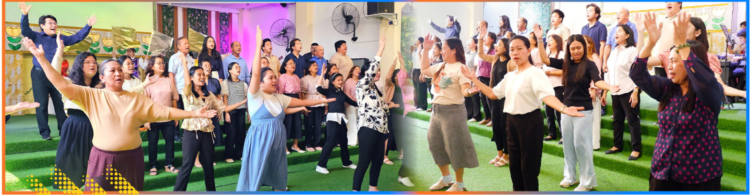
Isang pribilehiyo ang makapagsanay para sa pagluwalhati at pagpupuri Diyos.

Naging malaking bahagi ang mga naganap na workshop sa pagbubukas ng pagkakataon para sa pagkatuto ng mga miyembro. Kasama rito ang mga nagsasanay sa pagsasayaw na sumailalim sa pagkatuto ng mga basic steps para sa kanilang kasanayan.