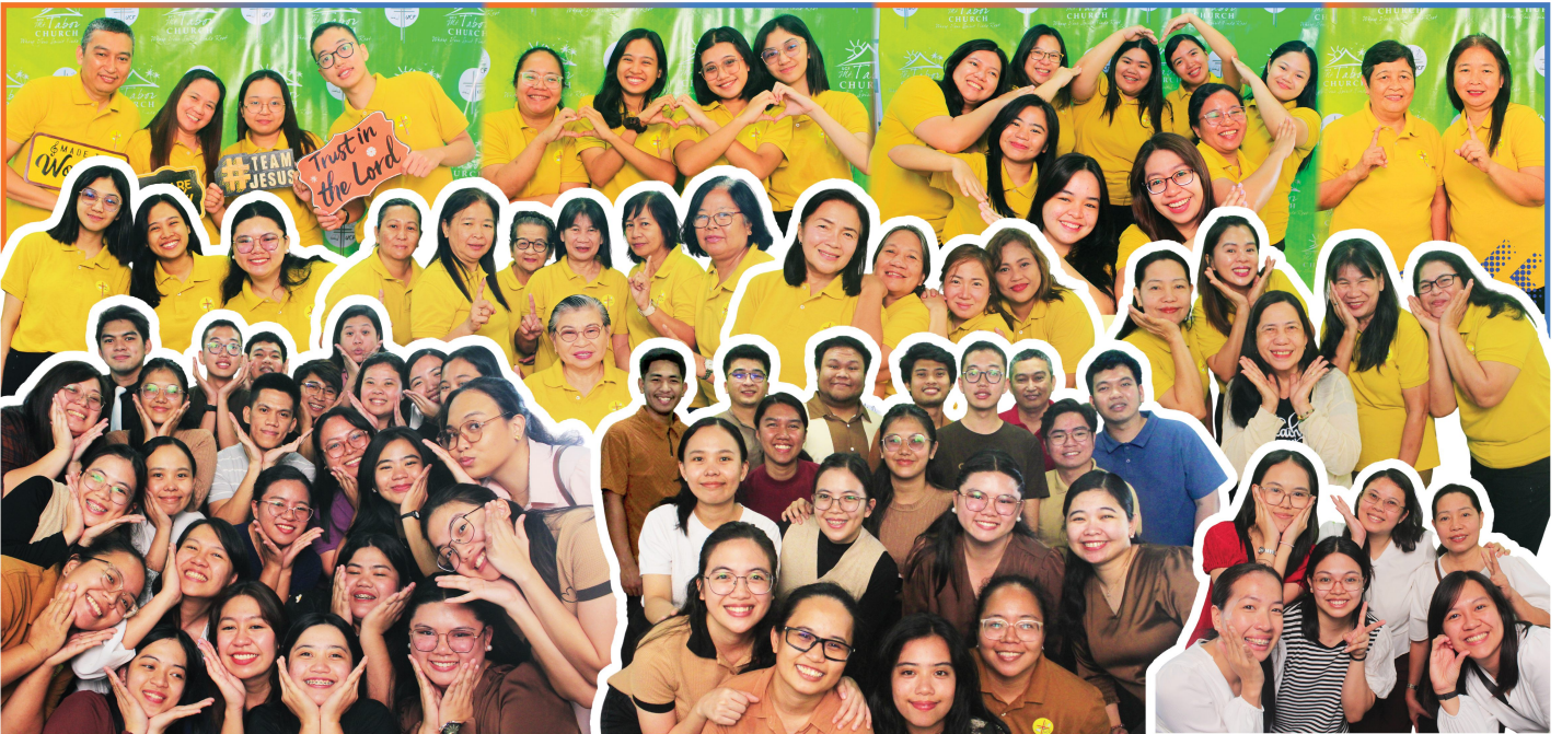
Ang bawat isa ay bahagi ng malaking plano ng Diyos para sa Kaniyang ministeryo kaya naman buong pusong susunod sa Kaniya ang bawat isa.