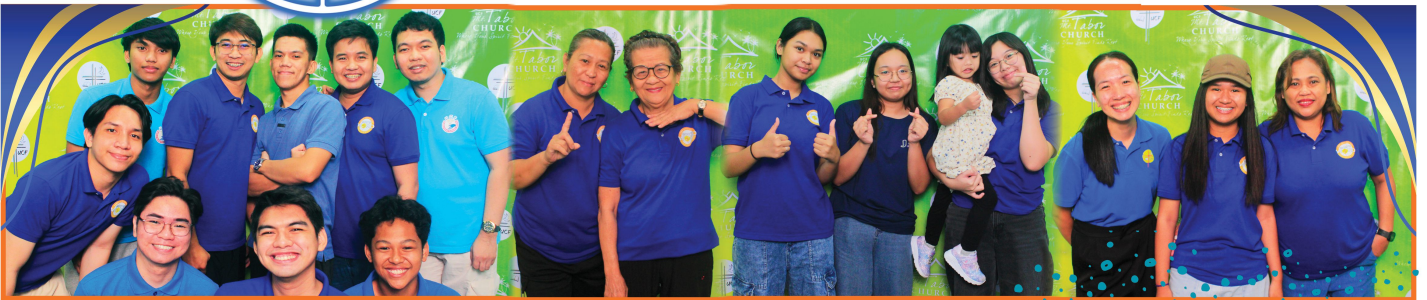
Tunay na ang Diyos ay naggalak din sa tuwing ang Kaniyang mga anak ay nagtitipon upang purihin at sambihin ang Kaniyang Ngalan.