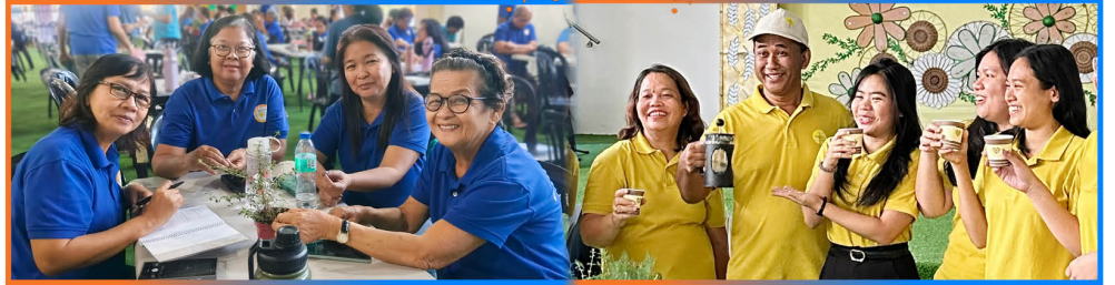
Tinuruan din ang kapatiran na gumawa ng tsaa gamit ang herbal plant .

Isang makabuluhang workshop din ang isinagawa patungkol sa Livelihood and Cooperative kung saan tinalakay ang mga benepisyong sa paggamit ng mga herbal plant . Hinikayat ang bawat isa na magkaroon ng kaalaman na makakatulong sa kanilang kalusugan maski sa kanilang pangkabuhatan.