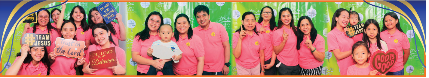
Ang pag-ibig na nagmumula sa Diyos na naranasan ng Kaniyang mga anak ang kanila ring naisasabuhay at naibabahagi sa iba.