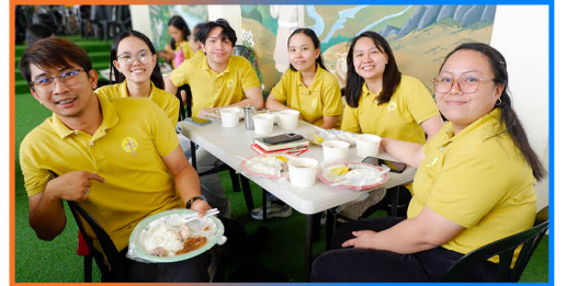
Tunay na dakila ang Diyos sa personal na pagkilos Niya sa buong kapatirang dumalo.